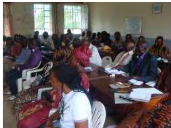
Photo 4 : Vue des participants à l'atelier de Kimpese